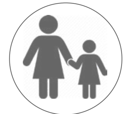
MOR OG DATTER (12) SOM TRENGER STØRRE BOLIG